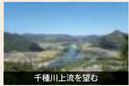
千種川上流を望む