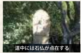
道中には石仏が点在する