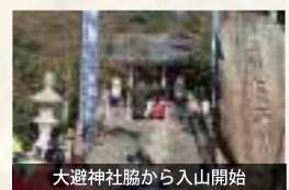
大遊神社脇から入山開始