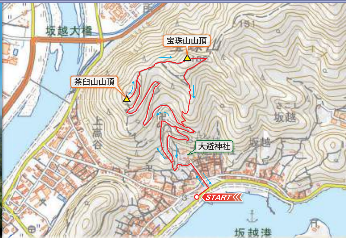
【この地図は、国土地理院長の承認を得て、同院発行の電子地形図25000を複製したものである。(承認番号 平30情複、第1179号)】