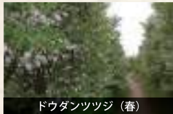
ドウダンツツジ (春)