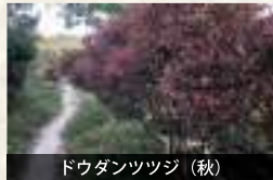
ドウダンツツジ (秋)