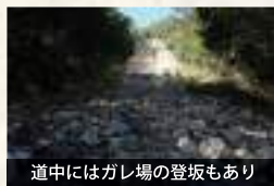
道中にはガレ場の登坂もあり