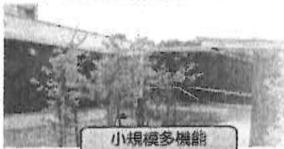
小規模多機能 温層の家