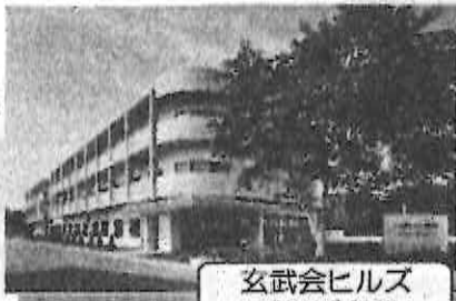
玄武会ヒルズ 就労けんす