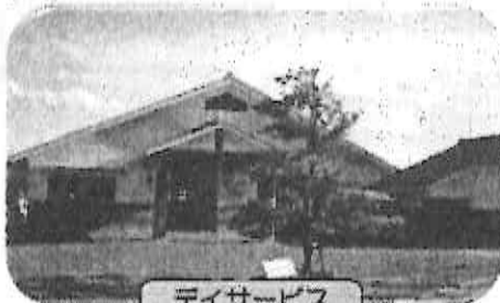
デイサービス いきしま