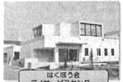
はくほう会 デイサービスセンター

伯鳳会グループは赤穂中央病院を母体とし、赤穂市内に入所施設系・通所施設系・訪問系・障害者系とさまざまな種類の介護事業所を運営しています。