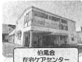
伯鳳会 在宅ケアセンター